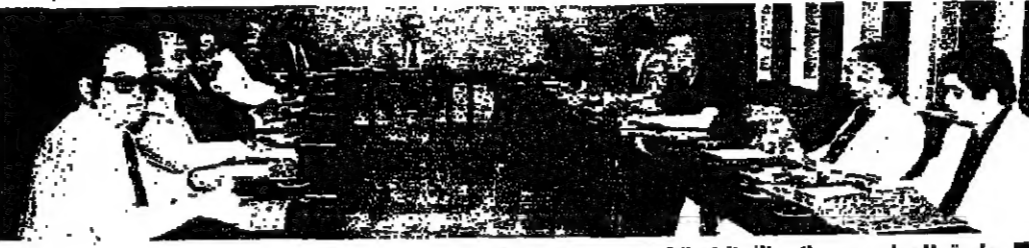
جلسة الحوار بين ممثلي الهيئات الاقتصادية والاتحاد العمالي مساء امس